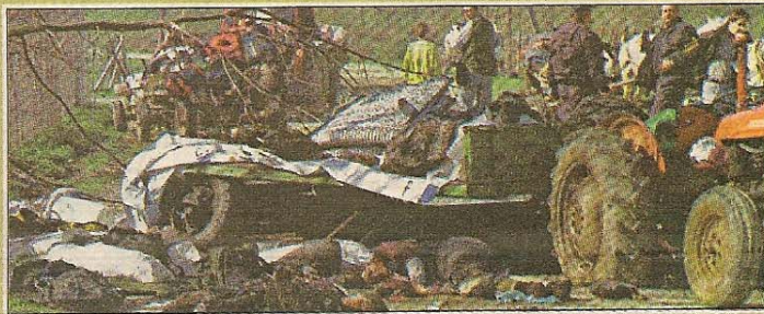
La strage di Djakovica, uno degli errori di cui è stata accusata la Nato